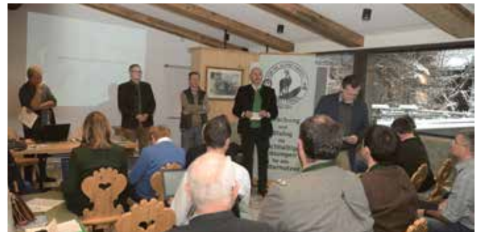
Bei der Fachtagung in Achenkirch wurde interessantes Wissen vermittelt.