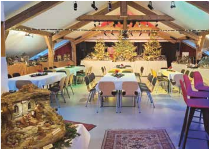
Im festlich gestalteten Saal des Kulturvereins Achensee fand am ersten Adventswochenende die Krippenausstellung statt.

Wir, die Achantaler Krippenfreunde, bedanken uns herzlich bei allen Besuchern, die unsere Krippenausstellung am ersten Adventswochenende mit ihrer Wertschätzung bereichert haben. Es war schön zu sehen, wie viele Menschen sich von den liebevoll gestalteten Krippen und der besonderen Adventsstimmung berühren ließen. Unser Dank gilt allen Helfern sowie den Krippenbauern, die mit ihrem Einsatz und ihren einzigartigen Werken zum Gelingen beigetragen haben. Ein besonderer Dank geht zudem an die Gemeinde, an den Kulturverein für die Bereitstellung des Saals sowie an unseren Pfarrer für seine Unterstützung. Die positive Resonanz motiviert uns, diese Tradition fortzuführen. Wir wünschen einen guten Start ins neue Jahr und freuen uns auf kommende Begegnungen. Die Achantaler Krippenfreunde