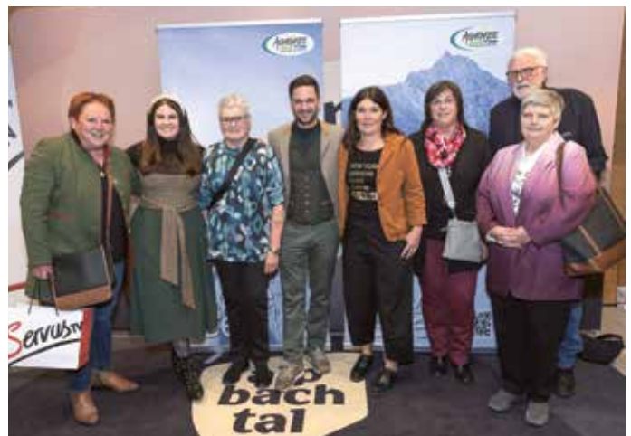
Auch das Team des Heimatmuseums Sixenhof ließ sich die Möglichkeit, die Sendung vorab zu sehen, nicht entgehen.