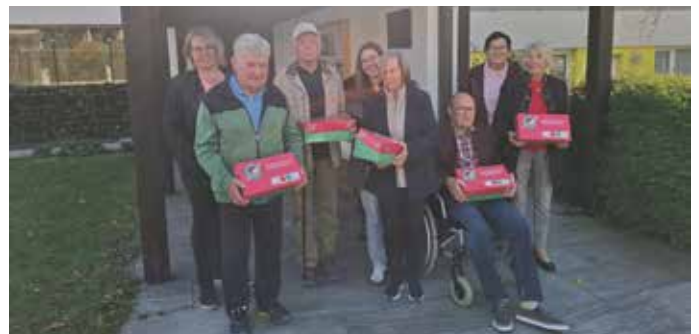
Herzliche Übergabe der Weihnachtskartons im Rahmen von „Weihnachten im Schuhkarton“ an die evangelische Pfarrgemeinde in Jenbach.

„Weihnachten im Schuhkarton“ ist die weltweit größte Geschenkaktion für bedürftige Kinder. Auch das Team und die Bewohner des SeneCura Sozialzentrums Eben befüllten liebevoll ihre Weihnachtskartons und übergaben sie an die evangelische Pfarrgemeinde in Jenbach. Für viele Kinder bedeutet das Paket im Rahmen dieser Aktion das einzige Weihnachtsgeschenk, das sie erhalten. Mit viel Herz wurden unsere Kartons mit Schulsachen, Spielzeug und Kuscheltieren gefüllt. All diese Dinge sollen Kindern, die ansonsten kein Weihnachten hätten, ein Lächeln schenken und ihnen zeigen, dass jemand an sie denkt. Nach einer herzlichen Übergabe in Jenbach folgte ein gemeinsames Mittagessen beim Bucherwirt. Bei guter Stimmung und netten Gesprächen fand unser Sozialprojekt einen würdigen Abschluss – eine wunderbare Aktion, die zeigt, wie viel Mitgefühl und Engagement in unserer Gemeinschaft stecken!