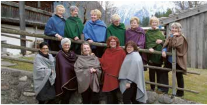
Der Singkreis freut sich über neue Sängerinnen aus der Region, die Freude am gemeinsamen Singen und an der Gemeinschaft haben.