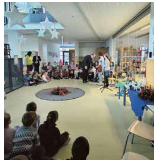
Bischof Hermann Glettler besuchte auch die VS Wiesing.