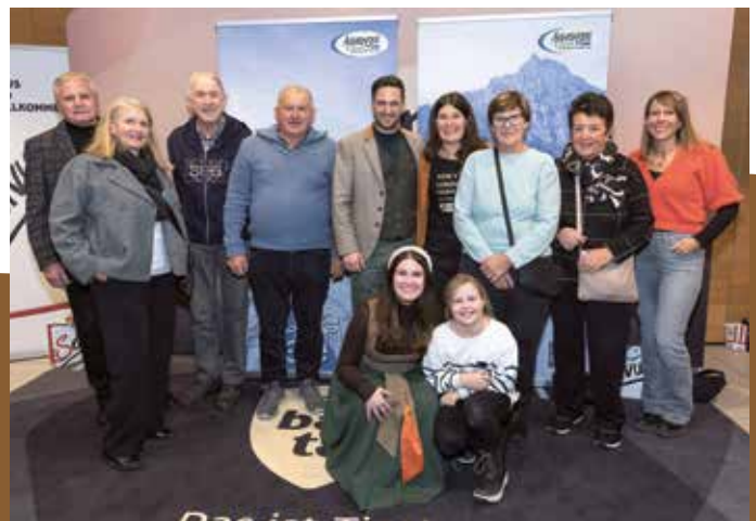
Die Dreharbeiten zur „Heimatleuchten“-Weihnachtsausgabe in den Regionen Achensee und Alpbachtal wurden von vielen ehrenamtlichen Mitwirkenden unterstützt.