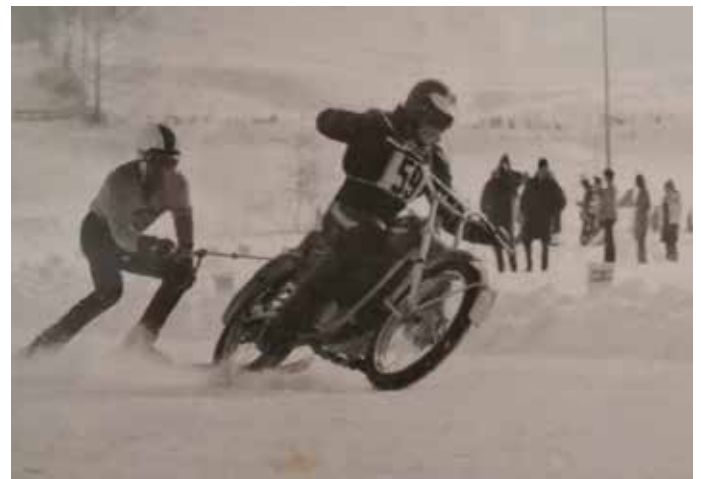
Mutig und rasant – so bezwangen die Athleten die Strecke.