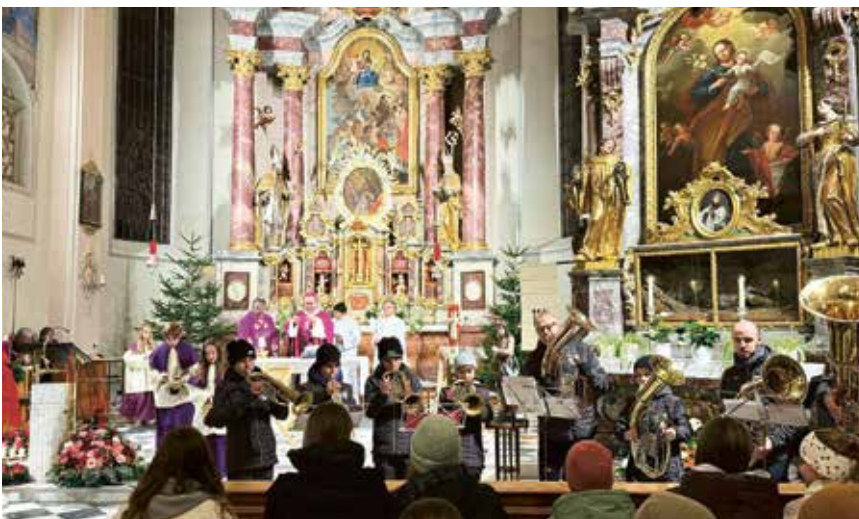
Jugendmesse in der Pfarrkirche Wiesing im Rahmen der Bischofsvisitation.