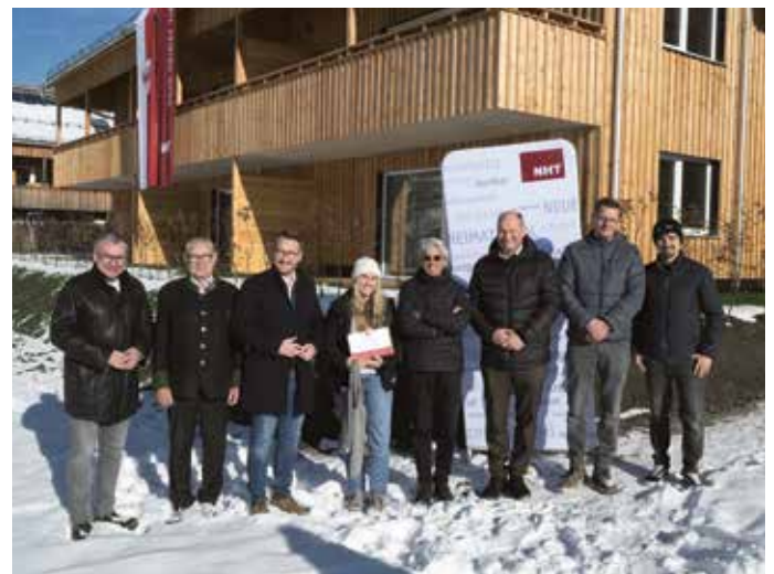
Ende November erfolgte die Schlüsselübergabe der Neuen Heimat Tirol an die Mieter.

Seitens der Gemeinde freut man sich sehr, dass die Abwicklung so reibungslos funktioniert hat und die Schlüsselübergabe noch vor Weihnachten stattfinden konnte. Wir wünschen allen Bewohnern der 9 Mietwohnungen viel Freude in ihrem neuen Eigenheim!