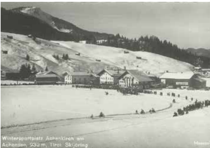
Skijöring-Veranstaltung Anfang der 1960er Jahre in Achenkirch.

Im Jahr 1973 schied die Motorsportsektion aus der Sportvereinigung aus und gründete sich als Motorsportclub Achenkirch neu. In den darauffolgenden Jahrzehnten etablierte sich der Verein sowohl in der heimischen als auch in der internationalen Motorsportszene – einerseits durch sportliche Erfolge seiner Mitglieder, andererseits durch die Ausrichtung zahlreicher Motorsportveranstaltungen im Sommer wie im Winter. Die Anfänge des Motorsports in Achenkirch in der Nachkriegszeit zeigen, wie früh die Begeisterung für motorisierte Fahrzeuge im Ort verankert war. Inoffizielle Rennen und Trainingsfahrten auf provisorischen Strecken, meist von technisch versierten jungen Männern organisiert, legten den Grundstein für eine bis heute fortbestehende motorsportliche Gemeinschaft. Maria Jaud und Fabian Woloschyn