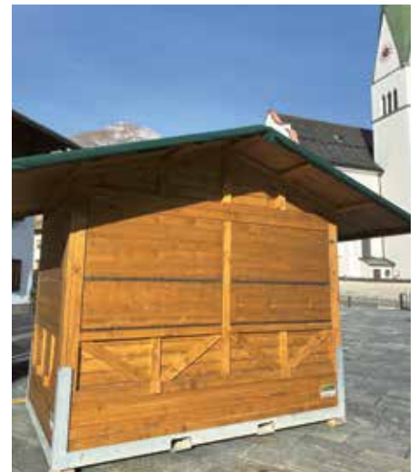
Neue Ausschankhütte für den Dorfplatz.

Für das Dorfzentrum Wiesing wurden zwei weitere Ausschankhütten angeschafft. Diese kommen künftig bei Veranstaltungen wie dem Weihnachts- und Bauernmarkt sowie weiteren Festen am Dorfplatz zum Einsatz. Ein herzlicher Dank gilt dem Tourismusverband Achensee, der die Hälfte der Anschaffungskosten übernommen hat. Durch diese Unterstützung können die Veranstaltungen im Dorfzentrum künftig noch attraktiver gestaltet werden.