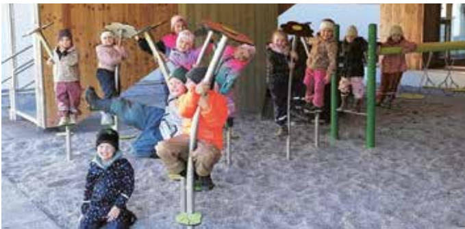
Der Kindergarten Pertisau freut sich sehr über den neuen Balancierweg.