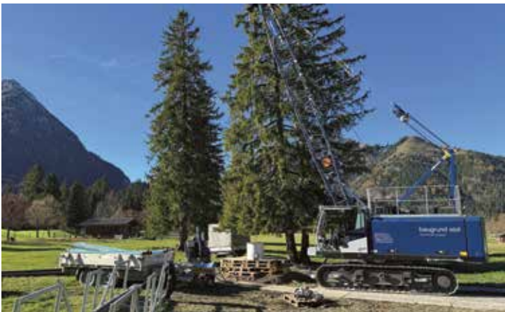
Die Bauarbeiten am neuen Tiefenbrunnen stehen kurz vor dem Abschluss – bereits diesen Winter wird die Wasserversorgung für die Beschneigungsanlage über den Brunnen verfügbar sein.

Nach einer erfolgreichen Probebohrung konnte in Pertisau, auf Höhe des Parkplatzes Karwendeltäler, mit dem Bau eines neuen Tiefenbrunnens begonnen werden, der nun kurz vor der Fertigstellung steht. Der Brunnen stellt einen wichtigen Schritt für die Wasserversorgung der bestehenden Beschneigungsanlage dar, die in den kommenden Jahren weiter ausgebaut wird. Darüber hinaus ist geplant, zukünftig auch den Golfclub Achensee für die Bewässerung der gesamten Golfanlage zu bedienen. Ein weiterer bedeutender Aspekt des Projekts ist die mögliche Nutzung als Trinkwasser-Notversorgung für die Gemeinde Eben. Die Finanzierung des Projekts erfolgt durch Achensee Tourismus. Damit wird ein starkes Zeichen für eine nachhaltige Infrastrukturentwicklung in der Region gesetzt. Ein besonderer Dank gilt Alois Rupprechter, der für den Bau des Tiefenbrunnens sein Grundstück zur Verfügung gestellt hat und damit wesentlich zum Gelingen des Vorhabens beiträgt.