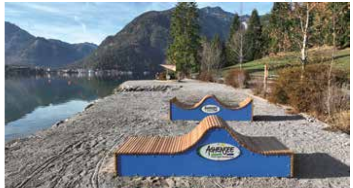
Gebrandete Wellenliegen laden zum Relaxen ein.