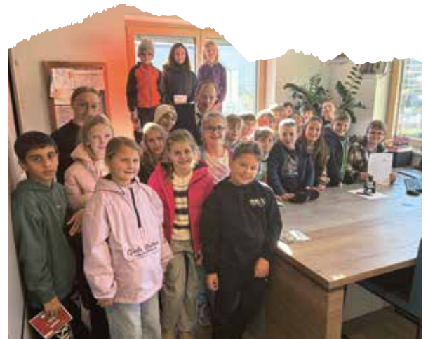
Spannender Blick hinter die Kulissen: Die 4. Klasse der Volksschule Wiesing erkundete kürzlich das Gemeindeamt.

Kürzlich besuchte die 4. Klasse der Volksschule Wiesing die Gemeinde. Dabei wurden alle Räumlichkeiten genau inspiziert. Außerdem standen der Bürgermeister und alle Mitarbeiter für Fragen zur Verfügung. Danke für eure Zeit!