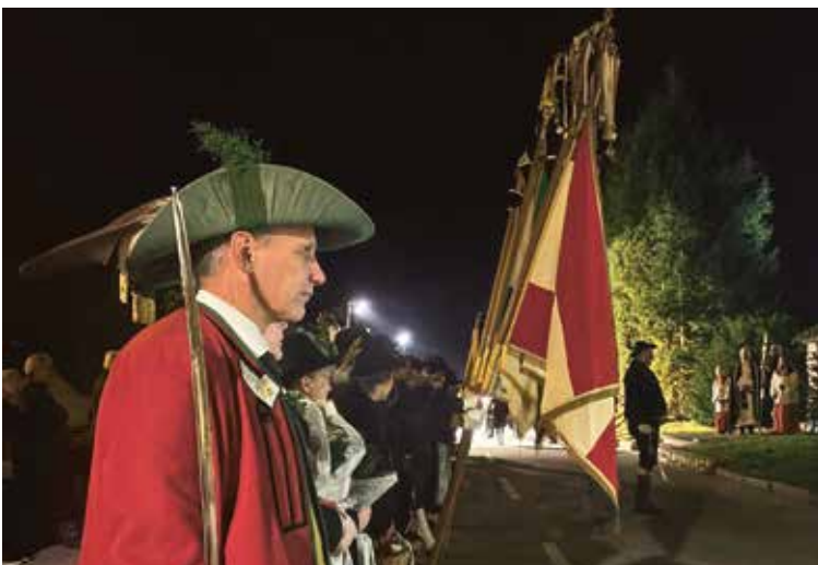
Gedenken mit Kranzniederlegung beim Kriegerdenkmal in Achenkirch.