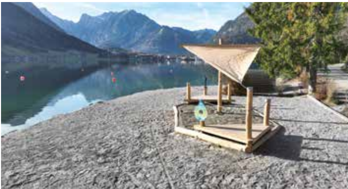
Die neue Station „Schifffahrt am Achensee“ mit gestrandeter Sandkisten-Segel- flotte direkt am Strand.

Wusel Wassergeist, das beliebte Maskottchen der Region Achensee, begeistert seit vielen Jahren vor allem junge Gäste. Nachdem bereits im vergangenen Jahr die über 15 Jahre alten Wusel-Illustrationen neu gestaltet wurden, erfolgte nun der nächste große Schritt: Acht Erlebnisstationen entlang des „Wusel-Wasserwegs“ wurden erneuert oder in ihrer Struktur überarbeitet. Zudem wurden auch die Übersichtskarte, die Wusel-Postkarte sowie die Wusel-Diplome neu gestaltet. Dies ist der Auftakt zu einer umfassenden Modernisierung des Erlebniswegs: Ein erneuertes Beschilderungssystem mit zweisprachigen Beschreibungen (Deutsch/Englisch) sowie spannenden Hintergrundinformationen zu Natur-, Wasser- und Regionalthemen rund um den Achensee sind an jeder Station geplant. Der rote Faden des Erlebniswegs zieht sich klar und einheitlich durch: vom Titel über das Maskottchen und die zugehörige Spielgeschichte bis hin zur äußeren Gestaltung der Stationen, dem Layout und dem gesamten Wegleitsystem. Die nächste Ausbaustufe ist für Frühjahr 2026 geplant, sodass bis zur Sommersaison alle Stationen wieder zeitgemäß und voll funktionsfähig sind. Die Finanzierung der Modernisierungsmaßnahmen wird vollständig von Achensee Tourismus getragen.