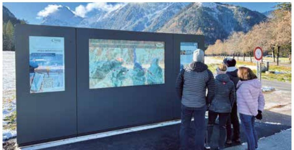
Die neuen Outdoorterminals in Achenkirch und Pertisau bieten tagesaktuelle Informationen zu Freizeitangeboten, Veranstaltungen und Loipen – ein digitaler Mehrwert für Gäste und Einheimische.

Die neuen Terminals ergänzen die persönliche Beratung sinnvoll, entlasten Betriebe und bieten zuverlässige Unterstützung vor Ort. Gleichzeitig reduzieren sie den Bedarf an gedruckten Informationsmaterialien. Dank robuster Outdoor-Technik, energieeffizienter Systeme und zentraler Contentpflege leisten die Outdoorterminals einen nachhaltigen Beitrag zu einer modernen, innovativen Gästeinformation in der Region.