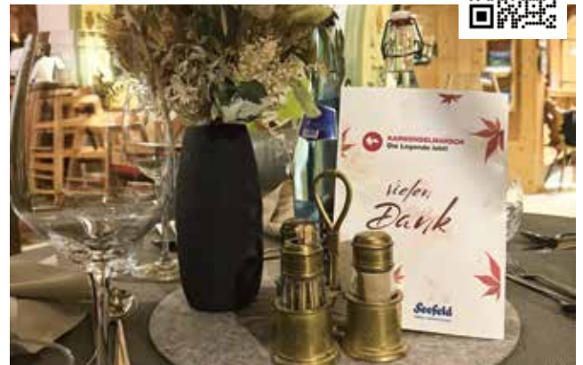
Herzlicher Dank an das gesamte Karwendelmarsch-Team beim Helferfest auf der Gramai Alm – für euren Einsatz und euren Beitrag zum Erfolg des Events.