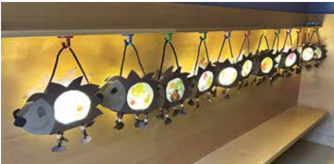
Die Igel-Laternen der Kindergartenkinder.

Am 11. November 2025 fand, wie jedes Jahr gemeinsam mit der Volksschule Pertisau, das Martinsfest statt. Wir zogen singend mit den Laternen zur Kirche, wo die Sankt-Martinsandacht stattfand. Dank der Volksschule Pertisau konnten wir uns im Anschluss an einer köstlichen Jause mit Kinderpunsch erfreuen. Wie jedes Jahr war das Martinsfest ein Highlight für Groß und Klein. Viel Freude macht den Kindern übrigens auch der neue Balancierweg am Spielplatz des Kindergartens.